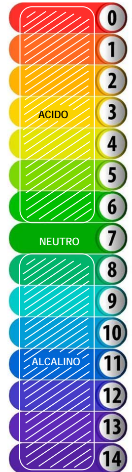
Scala del pH